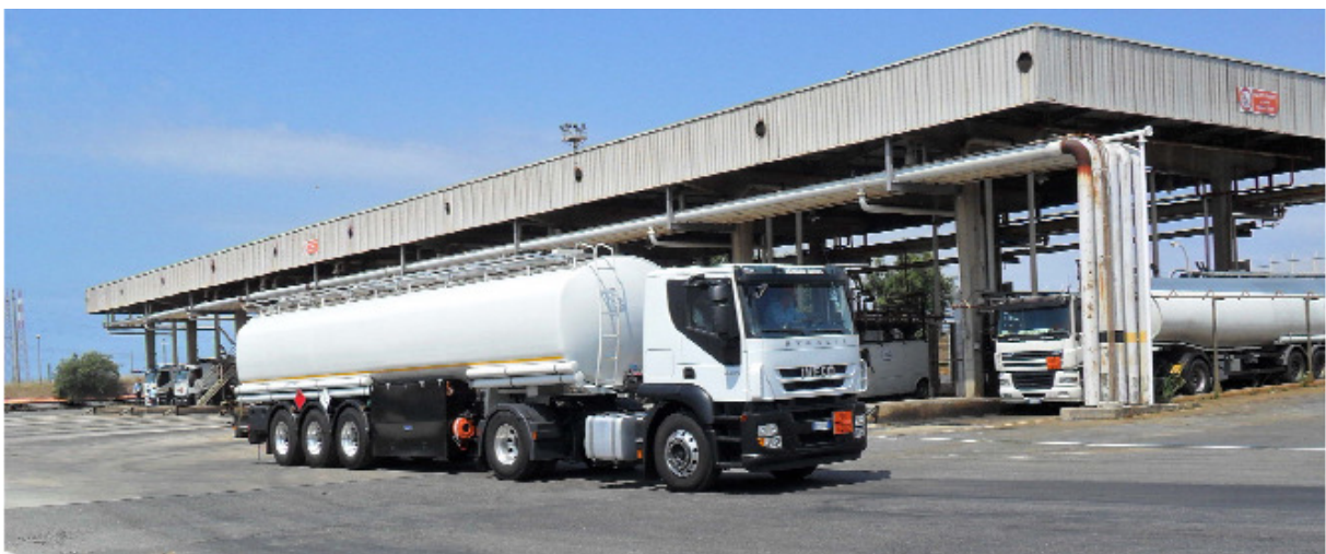
Abbildung 3 EGNOS-basierter Geräte zum Monitoring von eni Tankern

SCUTUM ist ein europäisches Projekt, das von der Europäischen Kommission gefördert und der GSA (European GNSS Agency) verwaltet wird. SCUTUM zeigt europäische Best Practice für die Anwendung von EGNOS bei Gefahrguttransporten. Im Rahmen von SCUTUM konnte sich eni , Italiens führendes Mineralölunternehmen, von den Vorteilen von EGNOS im Vergleich zu GPS alleine überzeugen, was die Sicherheit und Effizienz betrifft. Daher entschied sich eni beim Monitoren der für den Gefahrguttransport in Europa eingesetzten Tankfahrzeugflotte für die Verwendung von EGNOS. Bei Projektende im November 2011 waren es mehr als 300 Fahrzeuge, bei denen EGNOS zum Überwachen der Transporte von Kohlenwasserstoffen eingesetzt wurde – in Italien, Frankreich, Österreich, der Slowakei, Ungarn, Rumänien und der Tschechischen Republik (Abbildung 3). In Zukunft plant eni , den Einsatz von EGNOS auf chemische Produkte und Flugzeugtreibstoffe schrittweise auszudehnen und diese Technologie auch in Deutschland und der Schweiz sowie mittelfristig in anderen europäischen Ländern einzusetzen.