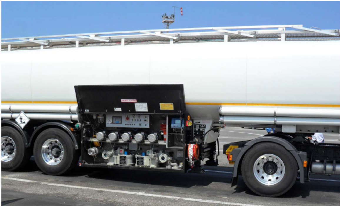
Abbildung 4 eni Tanker sind mit einer Vielzahl Sensoren ausgerüstet, darunter der EGNOS-fähige Ortssensor

Die Fahrzeuge sind mit EGNOS-fähigen Geräten ausgestattet (Abb. 4) und werden von eni via TIP (Transport Integrated Platform, Abb. 5) überwacht. Dort kommt der von Telespazio entwickelte EGNOS Location Server LCS zum Einsatz.